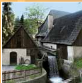
Фронауерский молот (сооружен в 1436 году)

Совсем близко находится много других достопримечательностей.