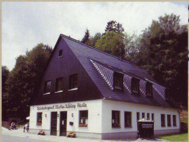
La maison de l'association